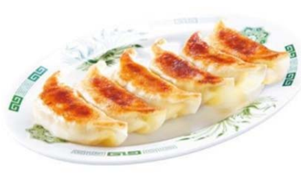
餃子 6個 300円